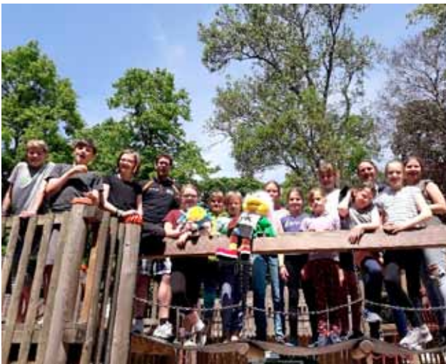
Kids by bike: Stimmung mit DJK Maskottchen Carli