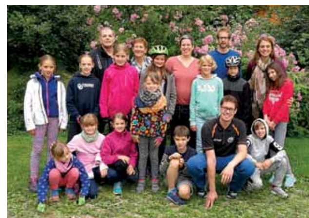
DJK Sportjugend mit den Rad-Kindern