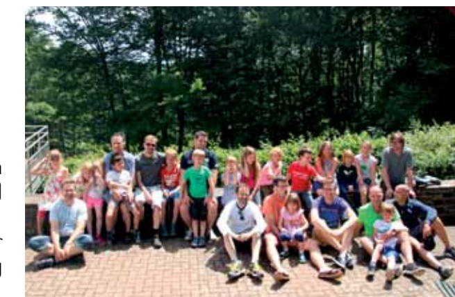
Zufriedene Väter mit glücklichen Kindern – oder war es umgekehrt?

Anmeldungen nehmen wir aber ab sofort unter info@djkdvkoeln.de entgegen.