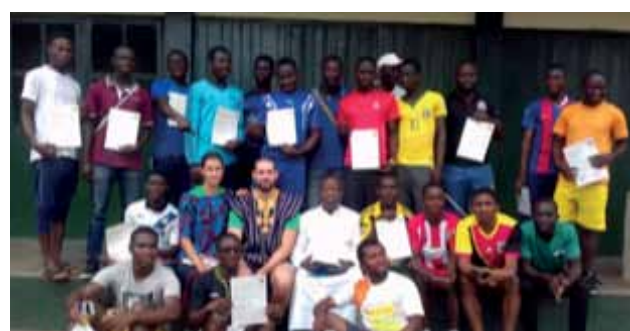
Die 1. Gruppe Fortgebildeter aus den ghanaischen Gemeinden im Bistum Cape coast